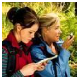
تماس با فشار یک کلید

کاربران می توانند به اشتراک پست الکترونیکی شخصی و کاری خود بصورت آنلاین و یا آفلاین دسترسی داشته باشند و پیام های خود را بخوانند و بنویسند.