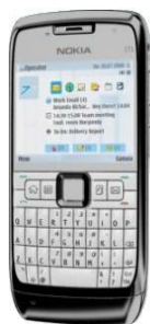
پست الکترونیکی سیار